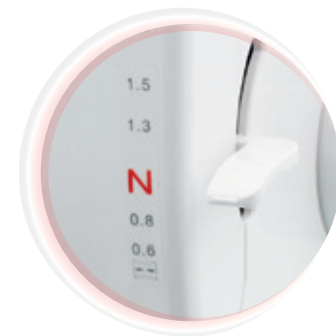
Differentialtransport Individuelle Anpassung des Stofftransportweges, um ungewünschte Wellenbildung bei der Stoffverarbeitung zu vermeiden.