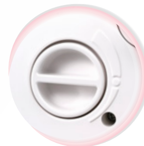
Optimale Einstellung des Füßchendrucks an unterschied- liche Stoffeigenschaften