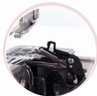
Robuste Greiferkanäle mit klappbarem Hilfsgreifer